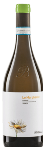
2023er Arneis Langhe DOC Bio Brandini, Piemont IT

Feinfruchtige Nase mit Nuancen von weißen Blüten und Zitrone. Am Gaumen mineralisch mit fein dosierter Säure und einer ganz feinen, sortentypischen Bitternote, animierend, ausgewogen und sehr lebendig. Ein Arneis, der selbst abgebrühte Fans der Sorte staunen lässt.